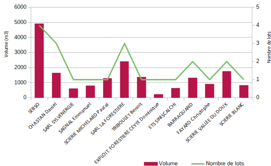
Volume et montant des achats par acheteur