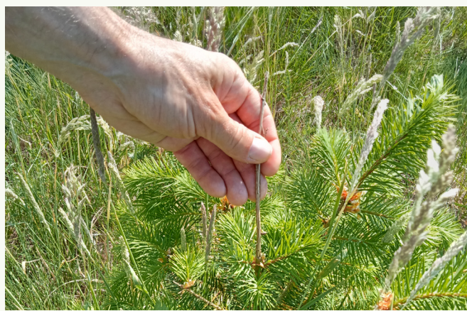
Dégât imputable au gibier : abrutissement de la pousse terminale d'un jeune plant de douglas

On mesure la pression du gibier sur un écosystème en quantifiant et en qualifiant les dégâts forestiers. Écorçage, abrutissement, frottis, labours peuvent, s'ils se généralisent, compromettre la capacité de régénération des peuplements. Sur une placette en régénération, lorsque la mortalité des jeunes arbres atteint 15%, l'équilibre est déjà menacé : on ne pourra le retrouver qu'en mettant en œuvre des mesures curatives. Il faudra donc adapter la gestion forestière ainsi que les pratiques cynégétiques.